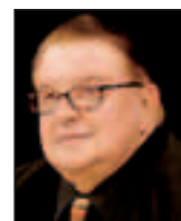
Article réalisé par Bernard IBAL, Président d'honneur de la CFTC Cadres

Le Gouvernement vient de sacrifier l'essentiel urgent (le vivre ensemble) sur l'autel du superflu inefficace (la consommation dominicale). ■