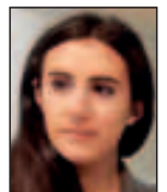
Article réalisé par Clémence CHUMIATCHER

Ce phénomène méconnu met encore en lumière une conclusion évidente mais qui coince au niveau du patronat : plus une entreprise investit dans la qualité de vie au travail et dans le bien être de ses salariés (aménagements de salles, mais aussi d'horaires, droit à la déconnexion) plus son retour sur investissement sera positif. Dans cette même logique, la CFTC Cadres recommande fortement la mise en place de cellule psychologique de soutien ou d'espaces de dialogue dans les entreprises. Une autre solution pourrait aussi venir d'une journée par semaine en télétravail, quand l'organisation de l'entreprise le permet, pour améliorer le bien être du salarié au travail. ■