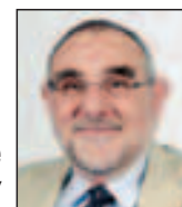
Article réalisé par Jean-Pierre THERRY

Les actions de formation éligibles sont référencées dans le cadre de l'utilisation de son CPF, y compris les formations visant à l'acquisition du socle de connaissance et de compétences. ■