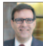
Article réalisé par Pierre LAMBLIN

Avec 6 intentions d'embauches sur 10, les jeunes cadres ayant entre un et dix ans d'expérience demeurent les profils les plus courtisés par les managers et les recruteurs, car immédiatement opérationnels, et ce, au détriment des débutants et des cadres plus séniors. La situation des jeunes diplômés sera encore difficile en 2015 pour accéder à un premier poste cadre, le retard par rapport aux années d'avant crise n'étant pas encore comblé en matière de recrutements. Ainsi, 35 000 débutants seraient embauchés comme cadres contre 48 000 en 2007. Le commercial, l'informatique et la fonction études R&D demeurent les trois fonctions qui recrutent le plus de cadres, ces deux dernières étant aussi traditionnellement des fonctions d'insertion de jeunes diplômés. Les fonctions informatique et études R&D seront à nouveau au rendez-vous en 2015, tirées respectivement par les activités informatiques et celles d'ingénierie R&D. ■